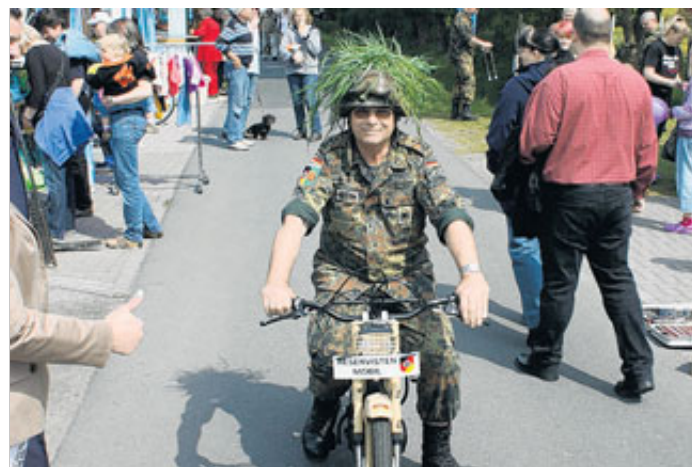
Der Reservistenverband Ostfriesland feierte in Leerhufe seinen 50. Geburtstag.

Die erste Party dieser Art am Ostring endete am Abend mit Musik. Für Stimmung sorgten die vier Bands von „Lachen helfen“. Die „Rockhofener“, Bad n Blue“, die „Blue Heads“ und die „Detonators“ heizten den Besuchern ein. Die Bandmitglieder der „Detonators“ haben sich übrigens bei einem Auslandseinsatz der Bundeswehr kennengelernt.