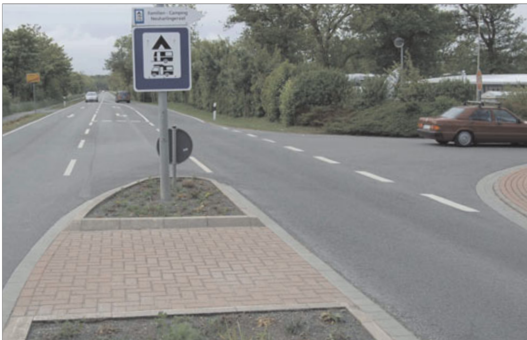
Die Einfahrt zum Campingplatz Neuharlingersiel soll mit einem Kreisell geregelt werden. Direkt daneben wird ein Supermarkt gebaut.